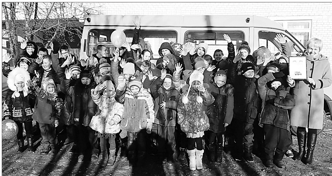
У учеников Озерской школы радостное событие