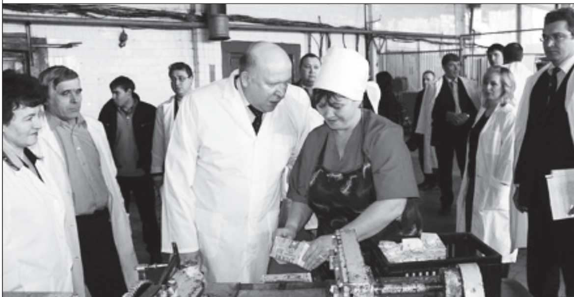
Визит В.П. Шанцева на Сергачский сахарный завод