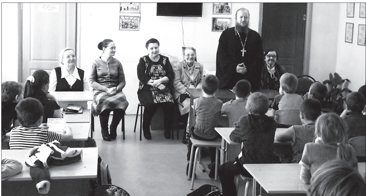
Члены православного клуба на встрече в «Роднике».

Каждодневно, ежечасно трудится весь коллектив, чтобы корабль «Родник» пришвартовался к тихой гавани с названием «Любовь».