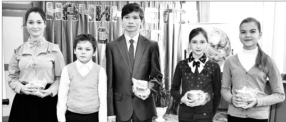
Победители викторины «Люби и знай родной свой край».

- Пильнинский район - район компактного проживания трех национальностей: русских, татар и мордвы. И до настоящего времени не было ни одного фильма, в котором была бы дана картина жизни многонационального района на рубеже XX и XXI веков, где были бы отражены национально-культурные традиции, видеосюжеты с мероприятий культурного, обра-