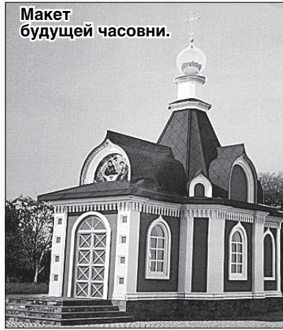
Макет будущей часовни.

В этот день епископ Лысковский и Лукояновский Силуан сослужил богослужения в Курмышской церкви, посетил дом-интернат этого села, побывал в церкви села Деяново и т.д.