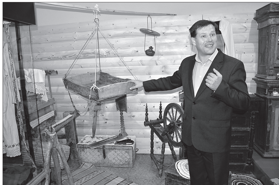
Директор музея рассказывает о экспонатах