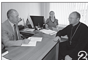
ГОД РАБОТЫ ДЕПУТАТСКОЙ ПРИЕМНОЙ