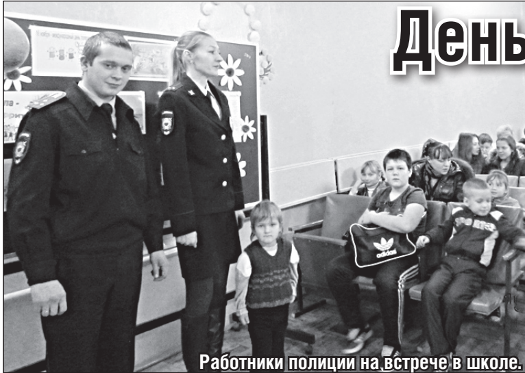
Работники полиции на встрече в школе.

20 ноября в 129 странах-членах ООН, в том числе в России, проводится Всемирный день ребенка. Дата выбрана не случайно. Она примечательна тем, что именно этого числа в 1959 году Генеральная Ассам-