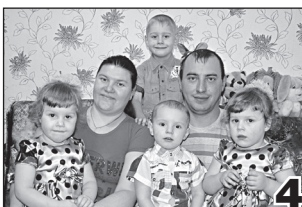
ВОТ ЭТО СЕМЬЯ - ЦЕЛЫХ ШЕСТЬ Я