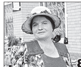
С ЛЮБОВЬЮ К ЖИЗНИ