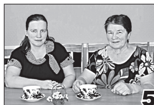
ЕСТЬ САМОЕ НЕЖНОЕ СЛОВО НА СВЕТЕ