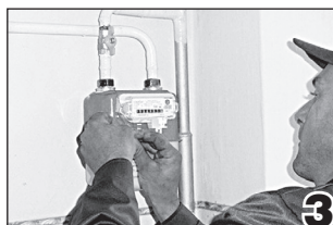
СКОЛЬКО РАЗ В ГОД ПРОВЕРЯЮТ ГАЗ?