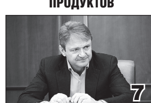
ЗА 5-7 ЛЕТ ЗАМЕТНО СНИЗИМ ИМПОРТ ПРОДУКТОВ