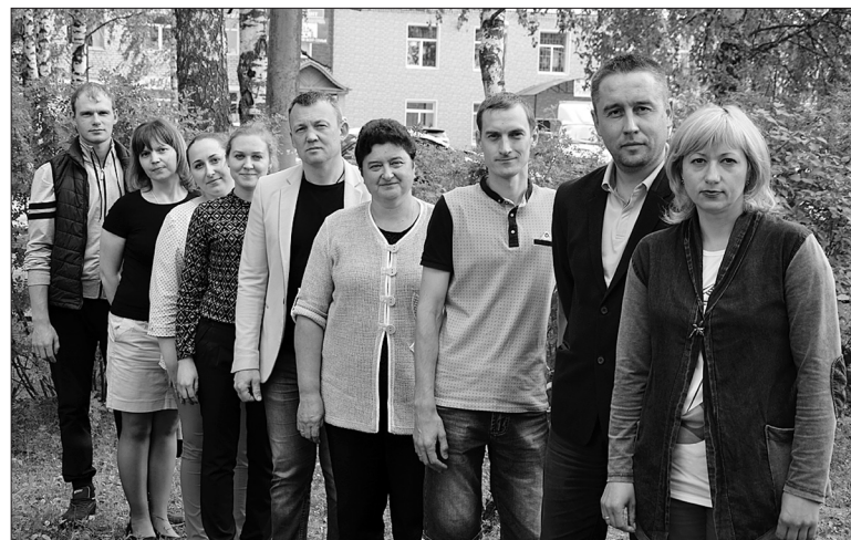
На собрании присутствовали члены обоих составов совета

- Наш совет состоял из 11 человек, и так получилось, что почти все мы были соседями с улицы Шалаева. Работали в традициях первого состава и начали с КВН на День молодежи, потом были мероприятия на День семьи, любви и верности, осенний бал, 23 февраля, и многое другое. Из нашего совета вырос клуб молодых