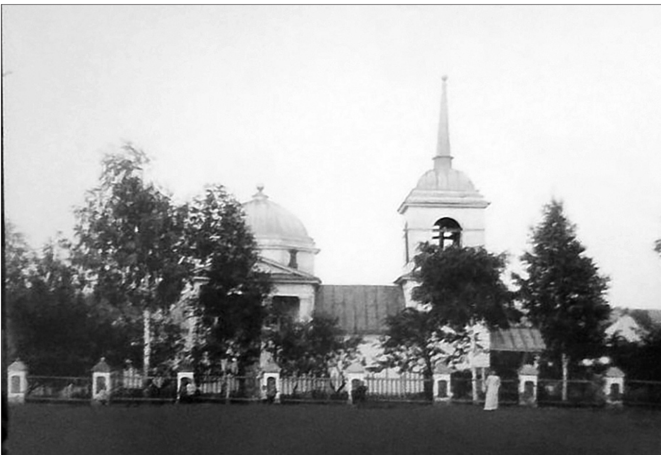
Церковь в с. Болобоново

Прежняя церковь, построенная в 1648 году, была деревянной и изрядно обветшала. По решению сельской общины ее разбирают и за 600 серебряных рублей продают в с. Лещёвку Васильевского уезда, вырученные средства идут на строительство новой церкви. При этом внутреннее убранство и иконы старого храма остаются в Деяново.