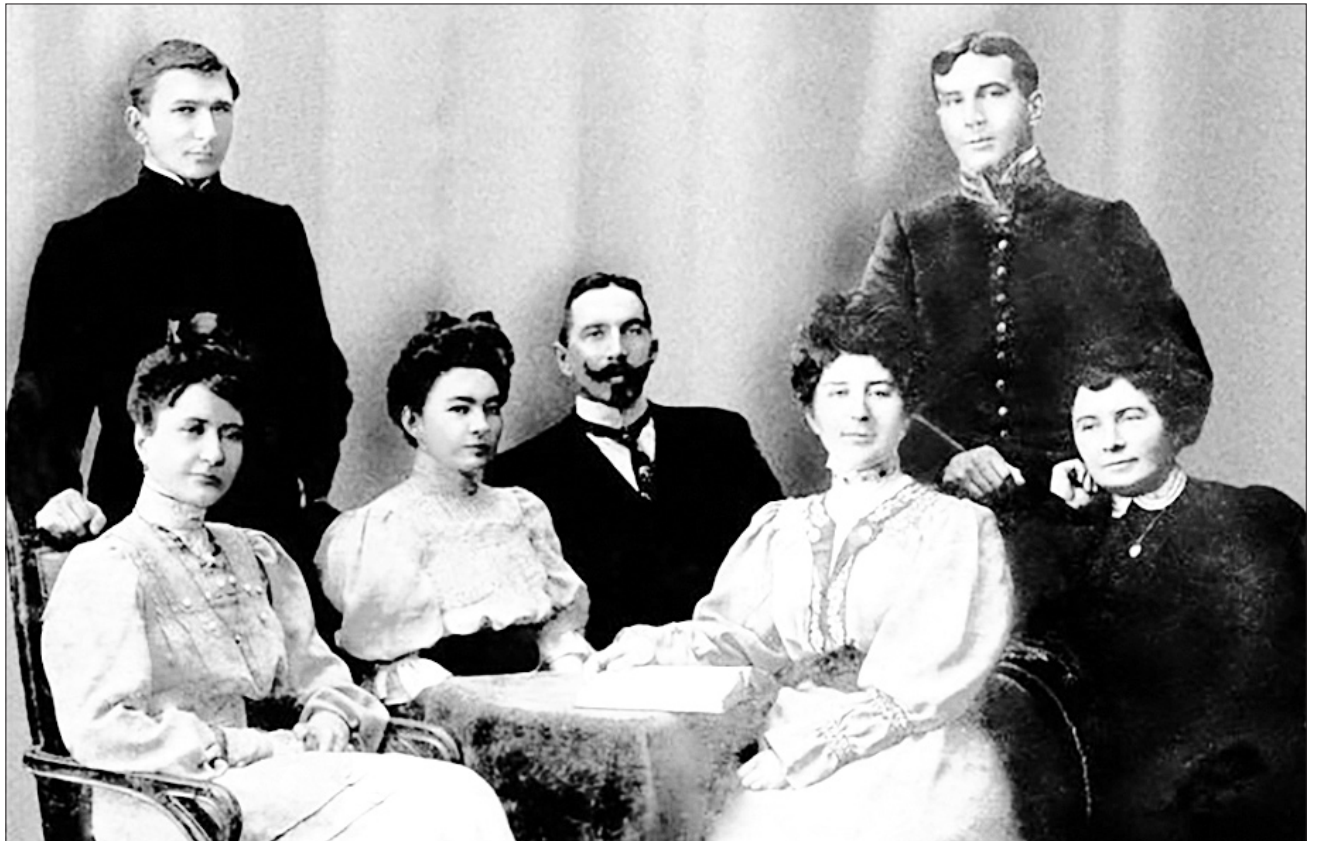
Младшее поколение семьи Шипиловых. Начало XX века

Прожив длинную жизнь и оставив после себя немалое число наследников, А.П. Шипилов в 1849 году умер, был похоронен возле Троицкой церкви с. Болобоново.