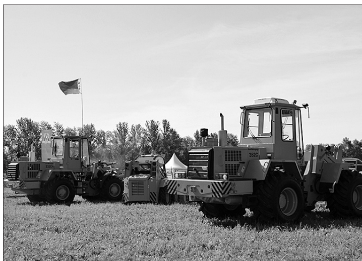
Выставочная площадка современной сельхозтехники