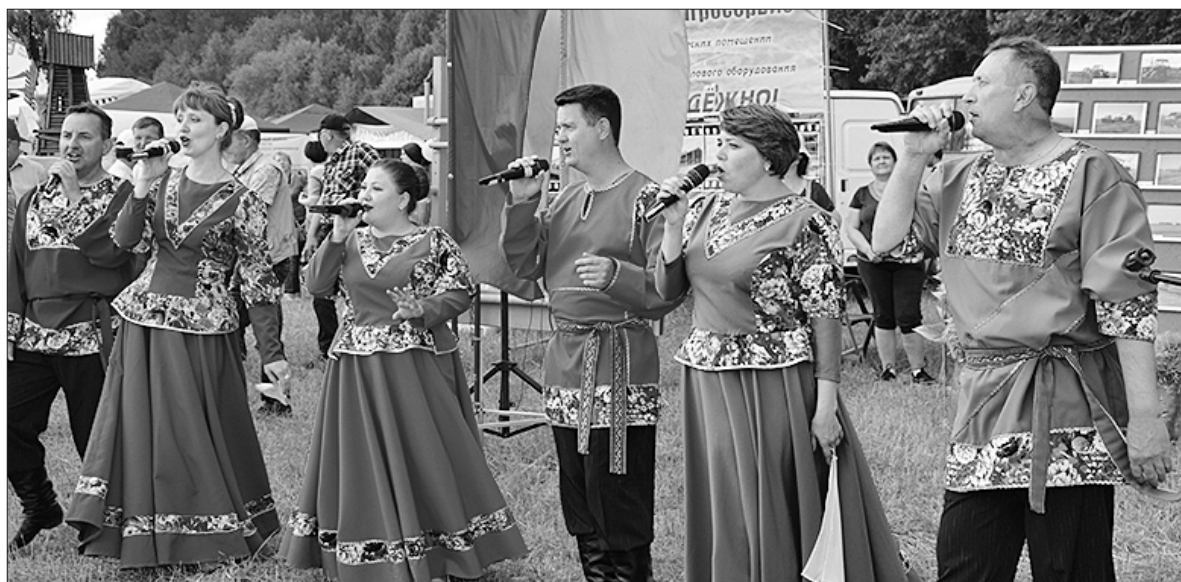
Выступление ансамбля «МIX Зоренька» принималось «на бис»