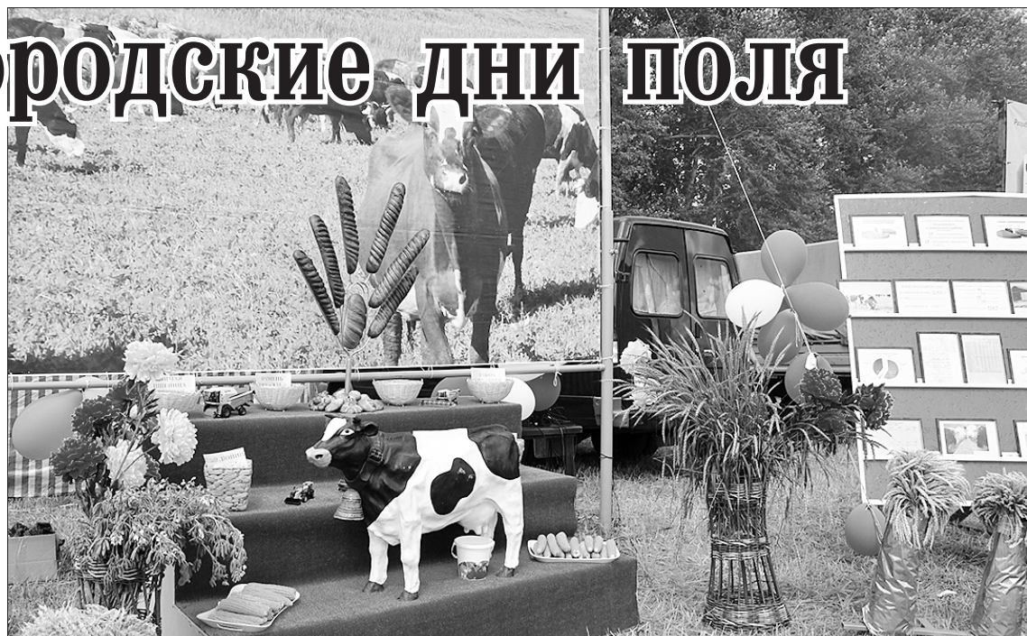
На выставке Пильнинского района было что посмотреть

А так как мы не один год являемся лидерами в области по производству молока, «украшением» экспозиции стала фигурка буренки и многие посетители выставки делали вместе с ней фото на удачу.