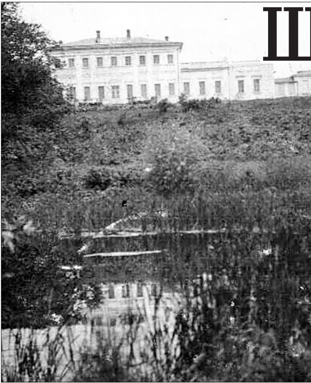
Дом-усадьба Шипиловых в с. Деяново. Начало XX века