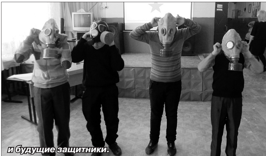
и будущие защитники.

В начале праздника своих одноклассников девочки поздравили стихами. Все дети исполнили песню: «Папа может всё, что угодно», а затем проходило соревнование. Ребята