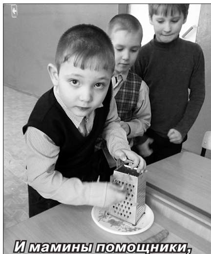
И мамы помощники,

15 февраля в Курмышской школе проводилась игра-соревнование между мальчиками начальных классов, приуроченная ко Дню защитника Отечества.