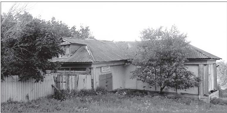
Старый магазин, где провели свою последнюю ночь перед гибелью 30 бортсурманцев

смерть от пули дважды миновала его. Дважды не расстрелянный, но убитый. Грудь в крестах, да голова в кустах.