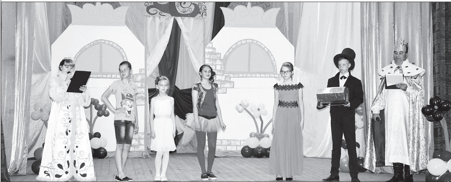
На конкурсе «Принцессы сказочного королевства».