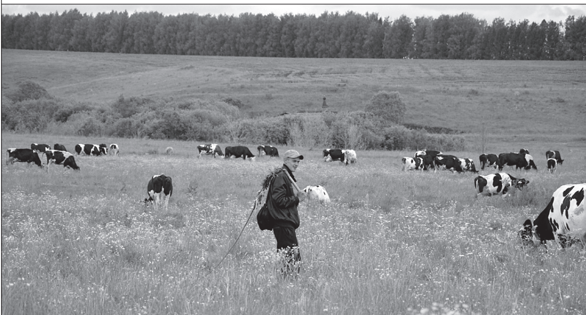
На пастбище СПК «Оборона страны».