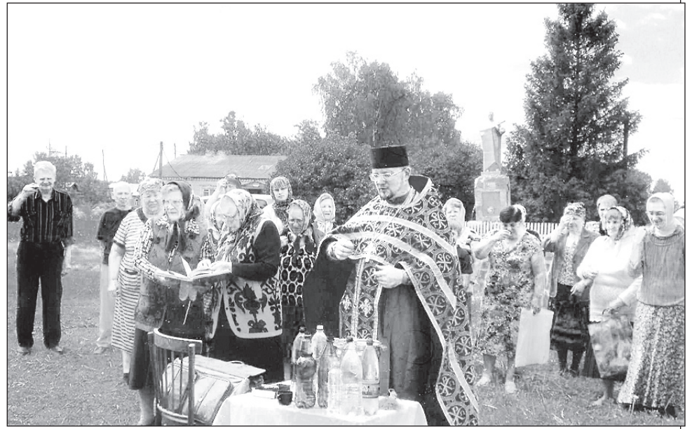
Во время службы.