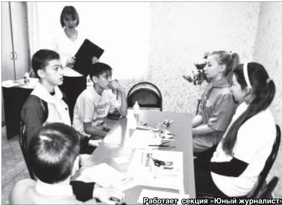
Работает секция «Юный журналист»

Под таким девизом прошли занятия районного союза детско-юношеских объединений