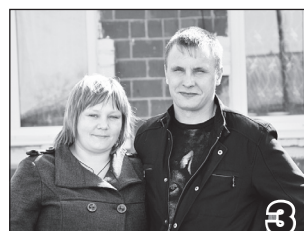
ДЕЯНОВО СТАЛО РОДНЫМ