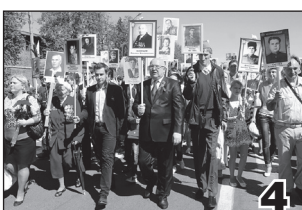
ПОБЕДНЫМ МАРШЕМ В «БЕССМЕРТНОМ ПОЛКУ»