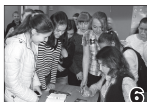
ОЛИМПИСКИЙ УРОК В ПИЛЬНЕ