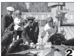
И ПОМНИ, МИР СПАСЕННЫЙ