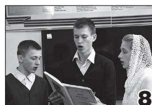
МЫ В ОТВЕТЕ ЗА СВОИ ПОСТУПКИ