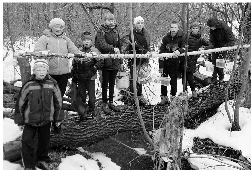
Переправа через ручей