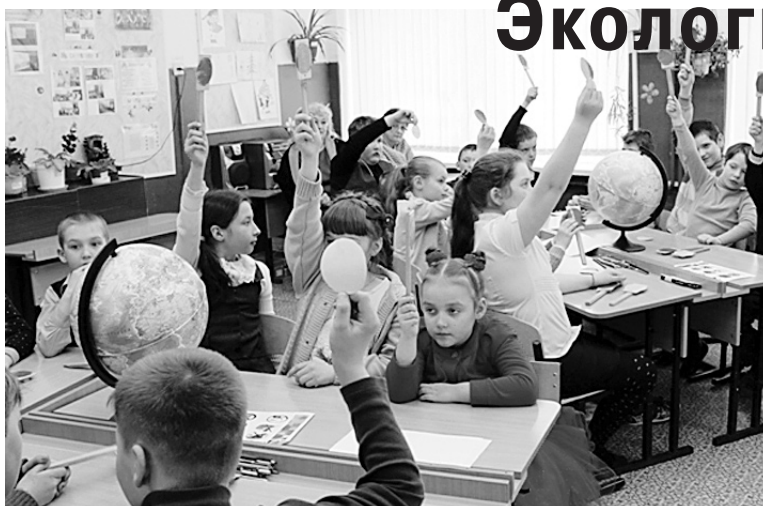
В Курмышской школе было проведено экологическое мероприятие «Берегите природу».

Ребята отправились в путешествие и побывали на различных станциях. Станция «Охрана природы», где дети читали сти-