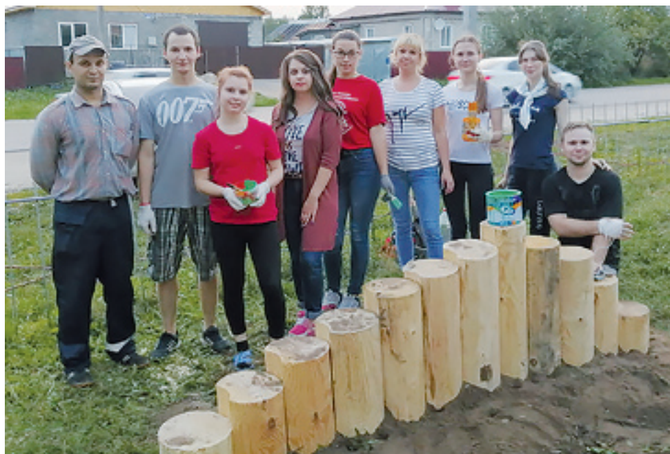
Молодёжный вклад в ремонт детской площадки

У нас в поселке есть детские площадки, которые приходят в негодность и потеряли свою привлекательность. Наши активисты решили исправить положение и провели косметический ремонт