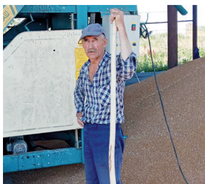
2 Такой трудной жатвы припомнить сложно