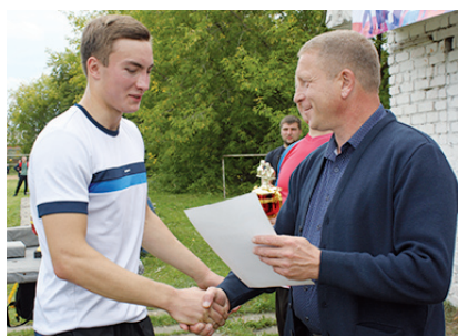
3 Каждый кузнец своего здоровья