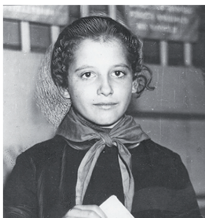
5 Вспомним мы об учёбе