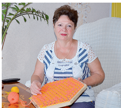
6 Есть женщины, которые нас восхищают