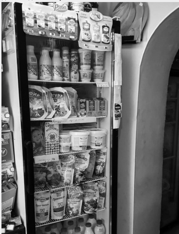
Наталья ГУСЬКОВА

13 августа 2019 г. представителями федерального партийного проекта «Народный контроль» был проведен мониторинг торговых точек, реализующих продукты питания на территории р.п. Пильна. Общественный контроль осуществлялся в рамках соблюдения требований выкладки товаров молочной продукции с содержанием заменителей молочного жира, согласно Приказу Минпромторга России и Роспотребнадзора от 18 июня 2019г. № 2098/368. В проверяемых магазинах, таких как: «Огонек», «FixPrice», «Пятерочка», «Магнит «У дома», были выявлены нарушения по выкладке молочной продукции, наличию обязательной информации на ценниках, информационному содержанию продуктовой полки. Руководителям данных торговых точек были даны рекомендации по устранению нарушений в кратчайшие сроки. Данный мониторинг будет продолжен до 22 августа 2019 г.