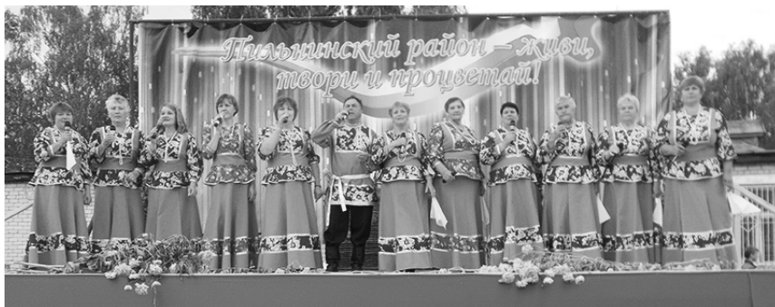
Хоровой коллектив «Рябинушка»