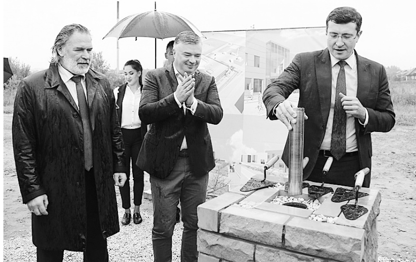
На закладке ФОКа