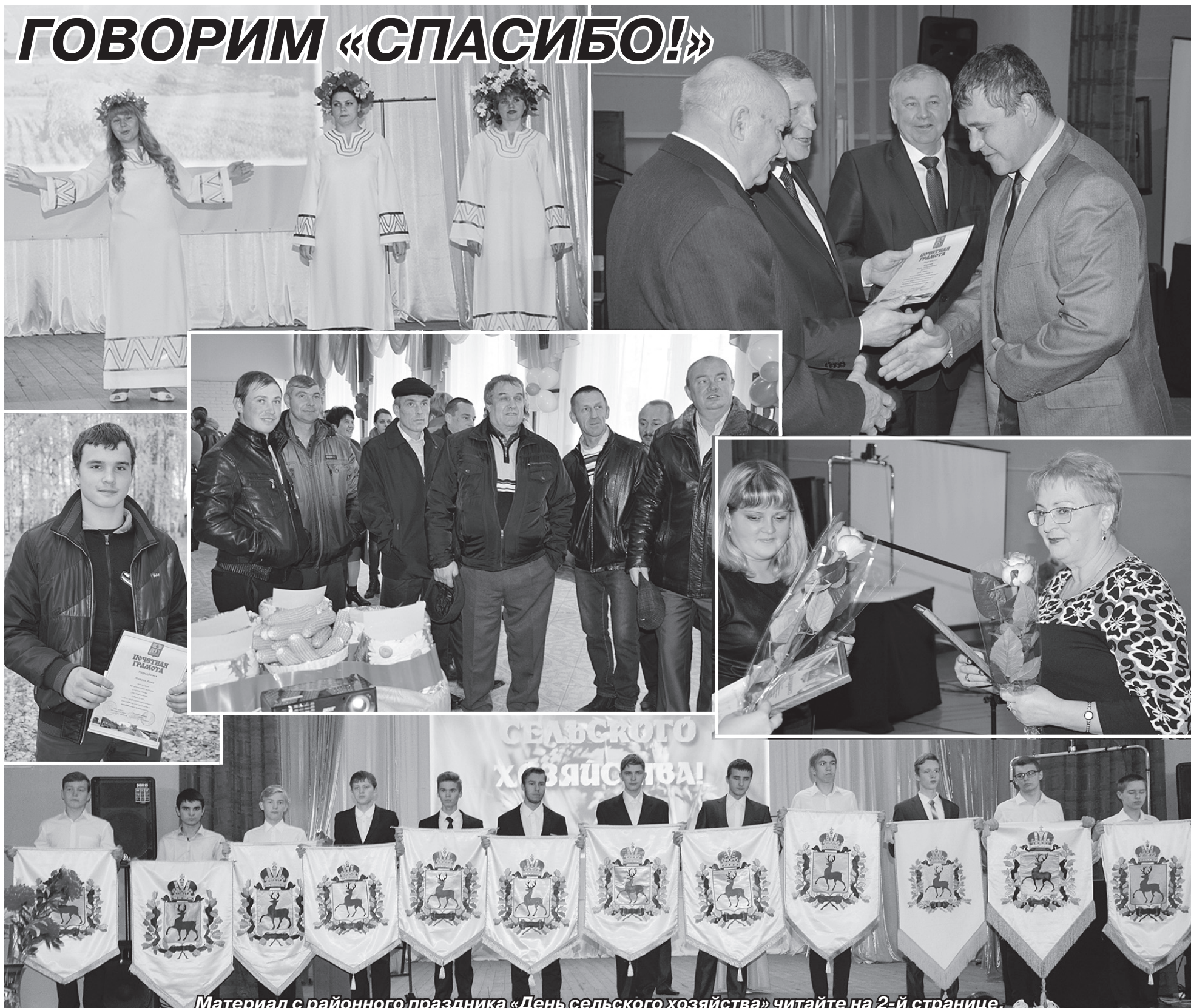
Материал с районного праздника «День сельского хозяйства» читайте на 2-й странице.