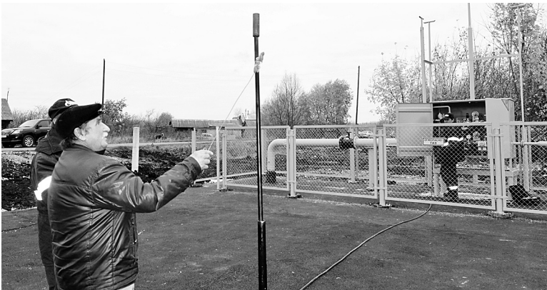
Пуск газа в с. Мамешево

21 октября в это село пришел газ. Этого события жители ждали давно. Три года назад было проведено первое общее собрание, где шел разговор о газификации села, а в декабре прошлого года сказали, что проект включен в программу Министерства сельского хозяйства.