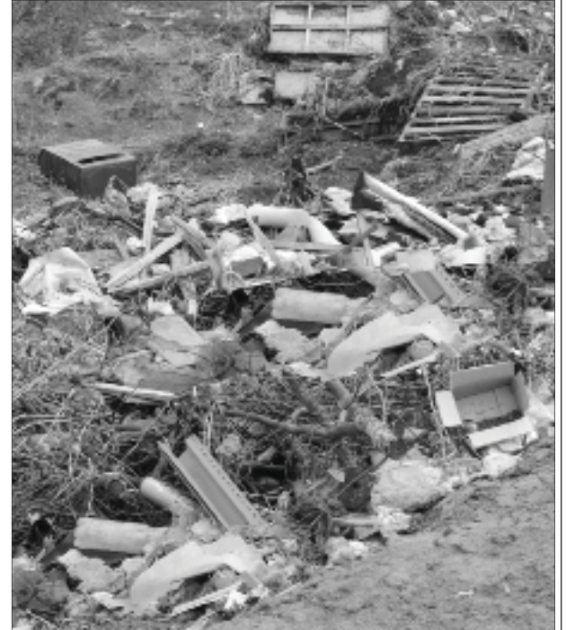
На снимке: съезд к р. Пьяна в конце ул. Коммуны.