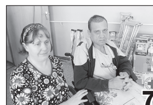
КРАСНЫЙ КРЕСТ В ПИЛЬНИНСКОМ РАЙОНЕ