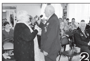
МУДРОЙ ОСЕНИ ПРЕКРАСНЫЕ МГНОВЕНЬЯ