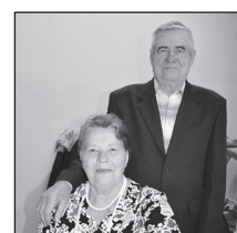
САМОЙ ВЫСШЕЙ ПРОБЫ ЮБИЛЕЙ!