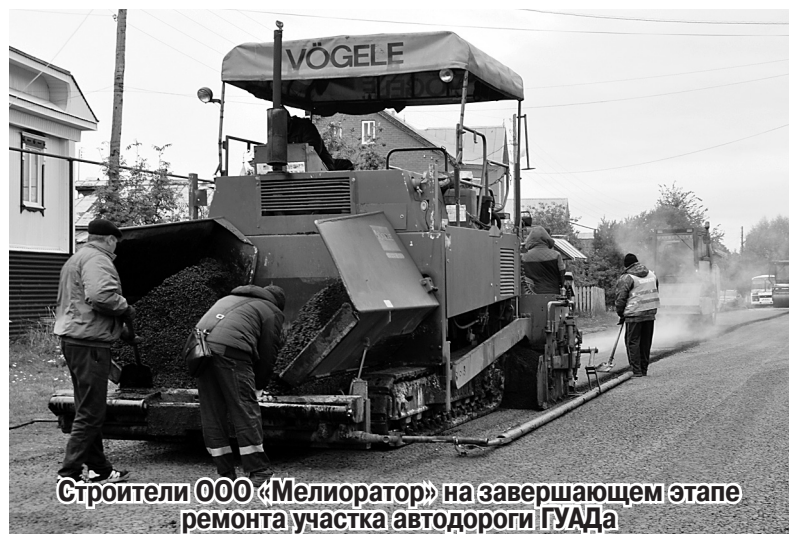
Строители ООО «Мелиоратор» на завершающем этапе ремонта участка автодороги ГУАДа