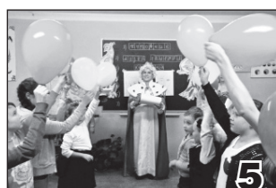
ПОСВЯЩЕНИЕ В МИР ИСКУССТВА