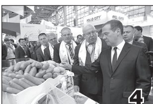
ПОКУПАЙ, РОССИЯ, НИЖЕГОРОДСКОЕ!