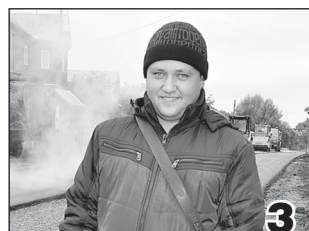
ДОРОЖНЫХ ДЕЛ МАСТЕР